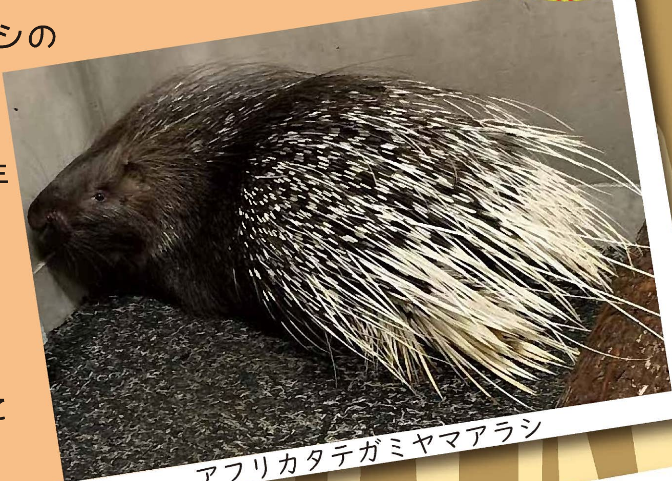
アフリカタテガミヤマアラシ

アフリカタテガミヤマアラシの『フランク』(オス3歳)が富士自然動物公園からやって来ました。当園では21年ぶりの飼育となります。体の後ろ半分に白黒まだら模様の長くてかたい体毛があります。『アフリカの草原』エリアにいます。見に来てね！