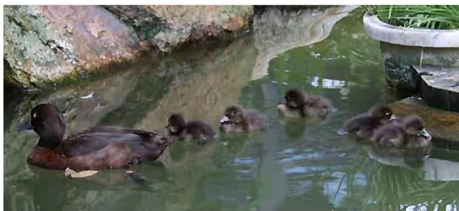
キンクロハジロの親子(9/2撮影)

7月24日に、グレビーシマウマのミンディーがオスの赤ちゃんを出産しました!これを皆さんが読んでおられる頃には、名前が決まっているかも!11月号で発表します。8月29日にキンクロハジロのヒナがかえって、にぎやかになった「京都の森・水禽舎」も見に来てくださいね!