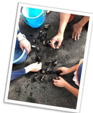
マツカサガイやオトコタテボシガイ。同じように見えるけど、見分けるポイントがたくさん！