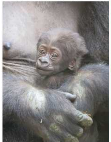
↑今は赤ちゃんが一番大事！ こんなに可愛いんだもんね♡

赤ちゃんが生まれて以来、ゲンキはトレーニングにあからさまに手抜きをしてくれます(^_^; 寄ってきて、「はいはい、これでしょ」と餌を食べながら右の肩を柵際に寄せ続け、「まだ何も言っていないよ！もう肩いらないし(笑)」という担当者とのやりとりを毎日しています(;^ω^) もう少し赤ちゃんから手が離せるようになればやる気も復活すると信じて、今はできることをやってもらっています。モモタロウは、注射のトレーニングが一進一退。いつもとちょっと違うことがあるとすぐ嫌になってしまいますが、回復も早く、一度嫌になっても数日後には針を5秒ほど刺せる程度には戻ります♪注射での生理食塩水の注入量、現在は2mlが最高記録ですが、目指せ新記録更新です！最近、乾燥した足に保湿剤をスプレーできるようになりました！手へのスプレーはまだ怖いようです(笑) 1年ほど前からトレーニングを始めたゲンタロウは、頭や耳、肩、胸、お腹、背中を柵際に寄せたり、手を柵から出すことができるようになりました(*^-^*)集中力に難ありですが、覚えはとっても早いです！少しずつでもいろんなことができるように、これからもゴリラたちのペースで頑張ってもらおうと思います。