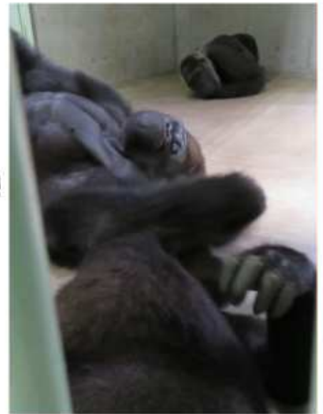
↑冷たい床でゴロゴロしながら遊ぶ父子と、ゴロゴロしながら監視する母(笑)