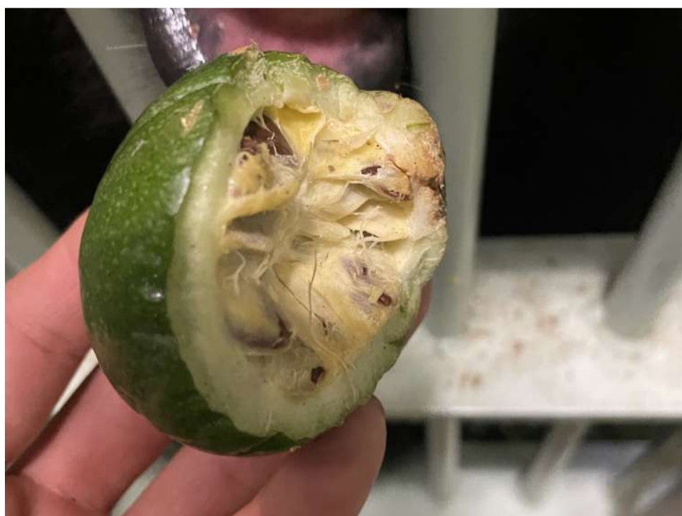
↑落ちていた実の一部。撮り忘れましたが齧った方の欠片もそばに落ちていました^^;

今月初め、ゴリラたちの収容後にグラウンドの掃除をしていると、齧られた実が落ちているのを見つけました！まだ熟してはいないようでしたが、直径5センチほどの大きさ。ゴリラのグラウンドで、この大きさまで実が食べられずに育つことはとても珍しいです。調べると、フェイジョアの実だということがわかりました。フェイジョアの木はこれまでに何本か植樹していて、花が咲いたところまでは見たことがあったのですが、どうやら知らないうちに実ができていたようです。フェイジョアはグアバなどの近縁種で、熟すと甘くなるキウですが、未熟だったためかほとんど食べずに齧って割ったものがほぼ丸ごと落ちていたので美味しくはなかったようです。味はともかく、ゴリラたちが自分で実を見つけ採って食べてみられたことが、担当者としてはとても嬉しい出来事でした♪