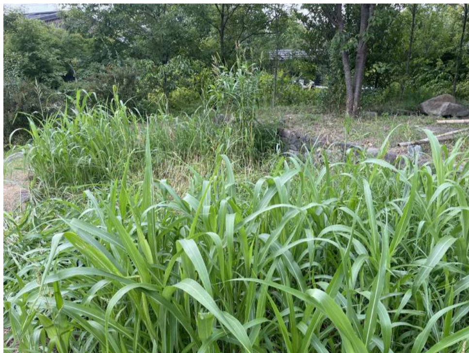
↑ゴリラたちの(笑)ソルゴー畑。中央奥の背が高いのが最初に、手前と左奥が2番目に生えてきたソルゴーです。

生き物・学び・研究センターの職員が園内で育ててくれている、ソルゴーという牧草。自由に刈って持って行っていいと言ってもらったのはいいことに、まるでゴリラたちのもののように日々刈ってきて与えていた担当者 ^^; 1か月ほどかけて、8月初旬に1番刈りを全てゴリラたちに与えられました！そして現在また新たにソルゴーが育ってきています♪これを刈ったものが2番刈りです。品種にもよるようですが、ソルゴーは2番刈りの方が1番刈りより茎が太くなるようです。ゴリラたちはソルゴーの茎の中身の部分が大好物。すでに少し収穫して与えた2番刈りのソルゴーもよく食べていました。普段餌として購入しているソルゴーが入るようになるのは毎年9月初め頃。今月中は少しずつ2番刈りのソルゴーを刈って、少しでも新鮮な牧草をゴリラたちに味わってもらおうと思っています。