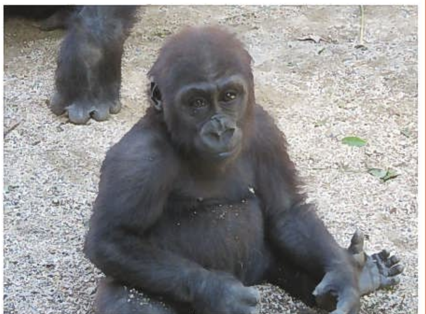
↑可愛くてつい甘やかしてしまいます…