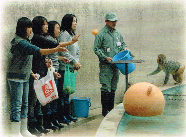
岡崎中学校の先生と生徒たちからリンゴやミカンなど果物がプレゼントされました！

初めてのお湯に興味はあるものの、いつもと異なる状況に少し警戒しているようです。プールの縁に並んで、触ってみたり、なめてみたり・・・。