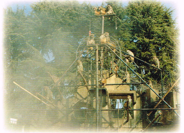
湯気が立ち上ります。サルたちは興味津々・・・。

トラックからつながれた給水ポンプをサル島のプールで受け取り、お湯を入れていきます。コンクリートのプールは冷たいので、冷めにくいように少し熱めのお湯を入れます。全部で約4トンのお湯が入れられました。