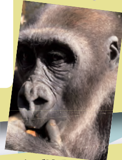
ニシゴリラ (キンタロウ)