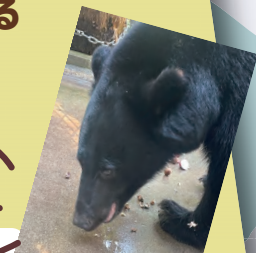
ニホンツキノクマ (ホノカ)