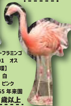
チリ-フラミンゴ 0001 オス 【脚環】 左:白 右:ピンク 1965年来園 58歳以上