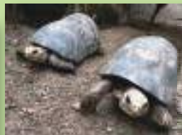
アカアシガメ 0001 オス (甲羅が長い) 0005 オス 1974年来園 48歳以上