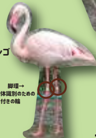
ヨーロッパフラミンゴ 0004 メス 【脚環】 左:白 右:ピンク 1977年来園 45歳以上