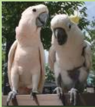
オオバタン「オーシロー」オス 1967年来園 55歳以上 キバタン「オキバ」メス 1974年来園 49歳以上