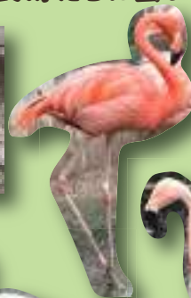
ベニイロフラミンゴ 0001 オス 【脚環】 左:白 右:ピンク 1965年来園 58歳以上