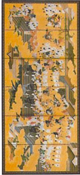
源氏物語車争図屏風（京都市歴史資料館所蔵）